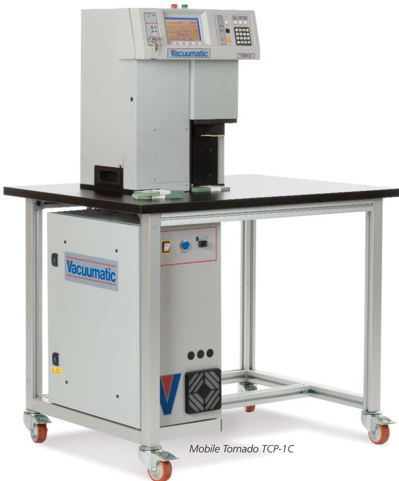
Mobile Tornado TCP-1C