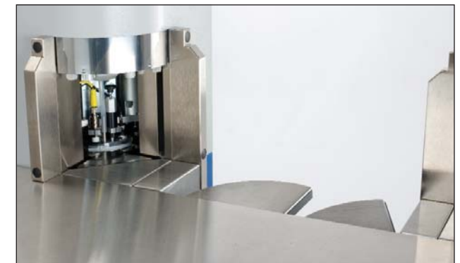
Robuste Papieranschlüge und verbesserte Stapelführung.