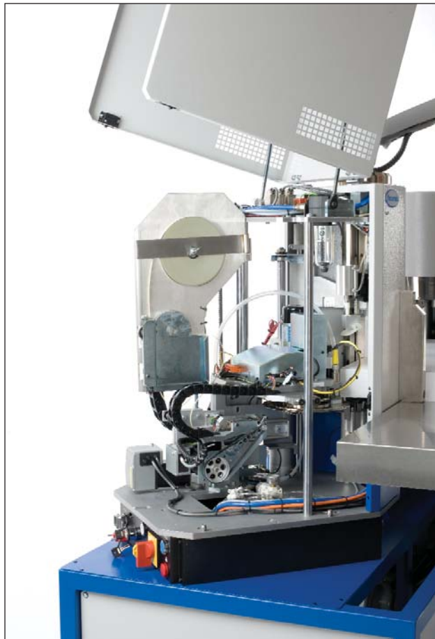
Einfacher Zugriff für die Wartung.

Die Super 30 von Vacuumatic – die flexibelste, zuverlässigste und qualitativ hochwertigste Doppelkopf-Zählmaschine für die Wertpapierindustrie - vereint bewährte Zähltechnologie mit neuesten elektronischen und Software Standards.