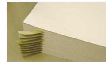
Papierbögen mit Streifeneinlegern.