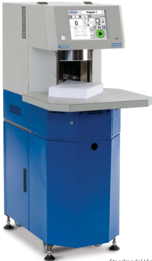
Standmodell Vicount 3 mit kleinem Tisch.