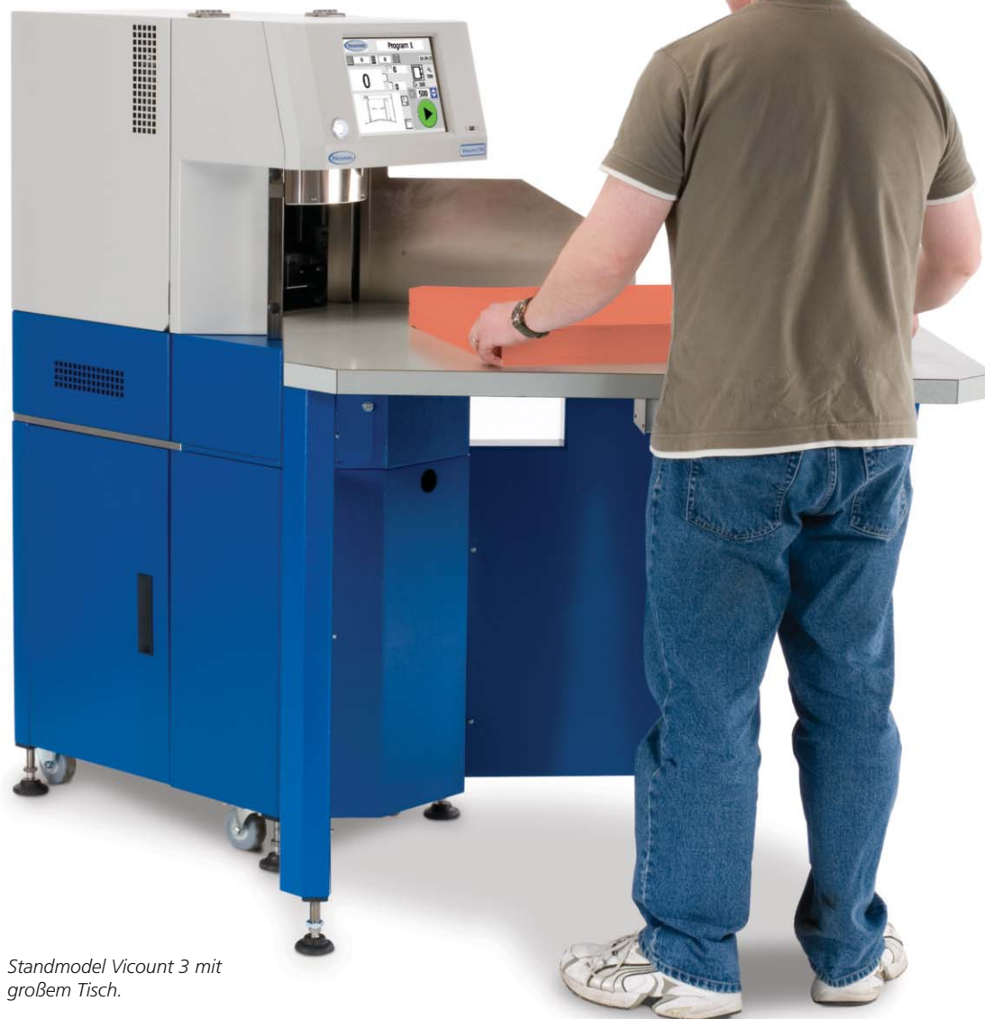
Standmodell Vicount 3 mit großem Tisch.