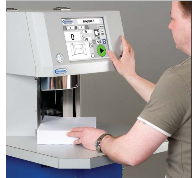
Tischmodell Vicount 3 mit Farb-Touch-Screen.

Vom Basis Tischmodell bis hin zur exklusiven industriellen Version, ob Geschenkpapier oder Steuerzeichen, die Vicount 3 wird allen Kundenanforderungen gerecht.