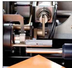
schneller Wechsel einer Saugplatte.